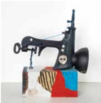
© Renate Brändlein, Foto: B. Steinacker

In den vergangenen zehn Jahren hat das artdepot viele interessante Begegnungen mit Kunstfreunden erlebt, musste aber leider auch einen nächtlichen Einbruch und zwei Wassereintritte überstehen. Allen Hindernissen zum Trotz hat sich